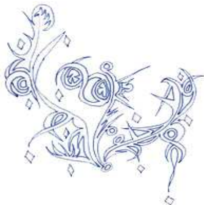
desen de Elena-Liliana Fluture