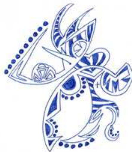
desen de Elena-Liliana Fluture