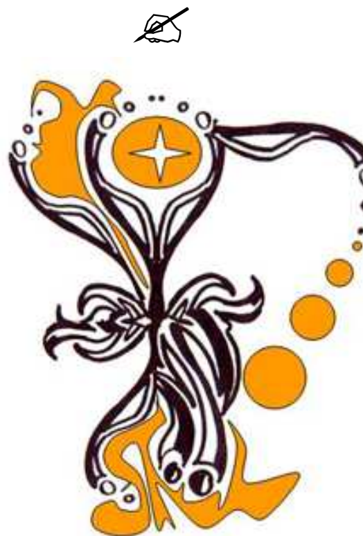
desen de Elena-Liliana Fluture