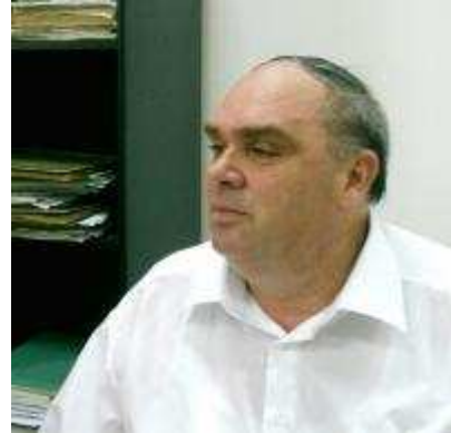
Scriitorul Ovidiu Dunăreanu

pământurile își deapănă șalurile de mătase ale aripilor, asemeni unor mimi de mare clasă, în ritmurile unui dans febril; cormorani moțați, țigănuși brun-verzui, cu ochi mărgelați, ca rubinul și cu ciocurile curbate și lungi cât andrelele, chirighițe ciufulite lopătează de colo-colo aerul aprins; lișite dolofane, corcodei și cufundaci poznași, de smoală, pescăruși albaștri vântură fără odihnă străfundurile; lebede maiestoase, cu gâturi de șarpe, pătate pe ciocuri cu purpură, prințese dintotdeauna încoronate sub geana subțire a pădurii, plutesc în cercuri largi, ținând în puterea lor lacul" (din volumul "Cu bucuria în suflet").