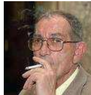
Poetul Cezar Ivănescu

Desigur că aceste cărți încomode, prin tonul acuzator și pamfletar, au deranjat o pleiadă de nume implicate mai mult sau mai puțin în derularea evenimentelor.