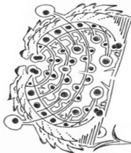
desen de Elena-Liliana Fluture