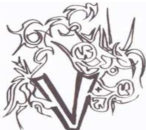
desen de Elena-Liliana Fluture