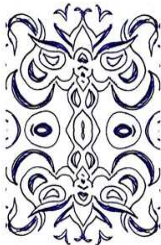
desen de Elena-Liliana Fluture