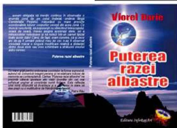
Viorel Darie - Puterea razei albastre Editura InfoRapArt, Galați, 2010

Autorul volumului de povestiri "Puterea razei albastre" își "descarcă" în scris sufletul supraîncărcat de nostalgia locurilor natale. Pe meleagurile de basm ale Bucovinei se petrec lucruri neobișnuite, care amplifică misterul nopților de vis din această minunată zonă de munte. În plus, o frumoasă poveste de dragoste animă întreaga poveste.