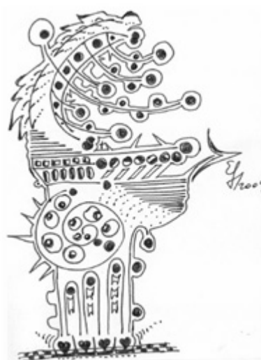
Desene de Elena-Liliana Fluture