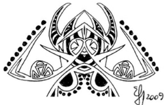
Desene de Elena-Liliana Fluture