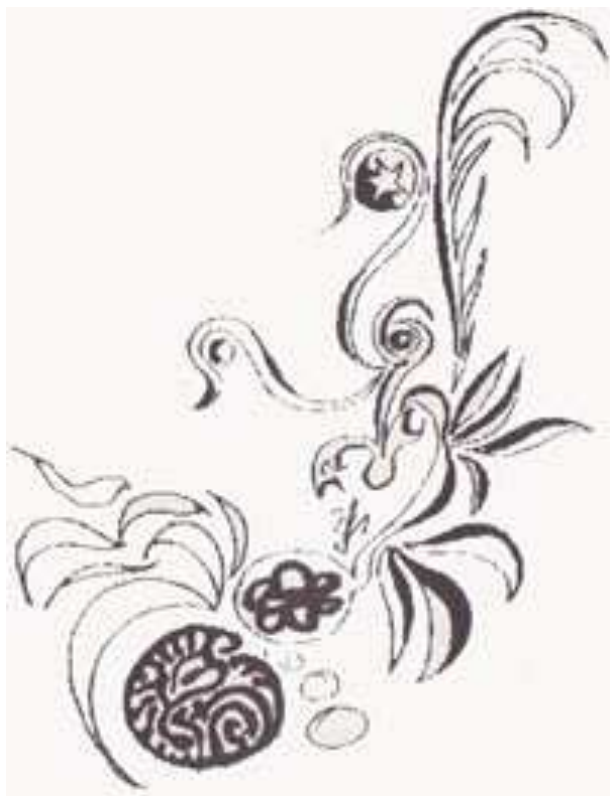
desen de Elena-Liliana Fluture