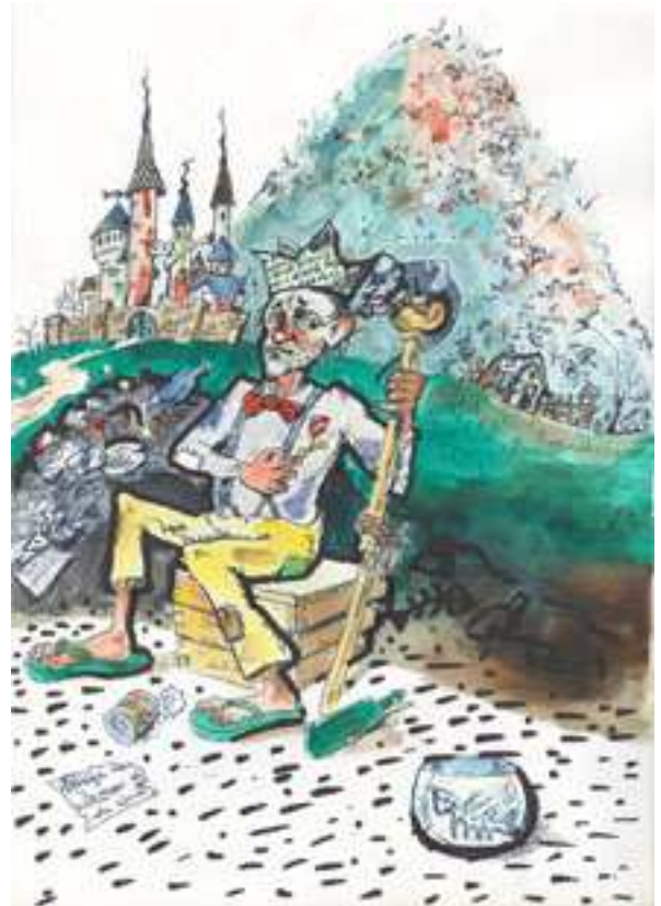
desen de Victor Cilincă