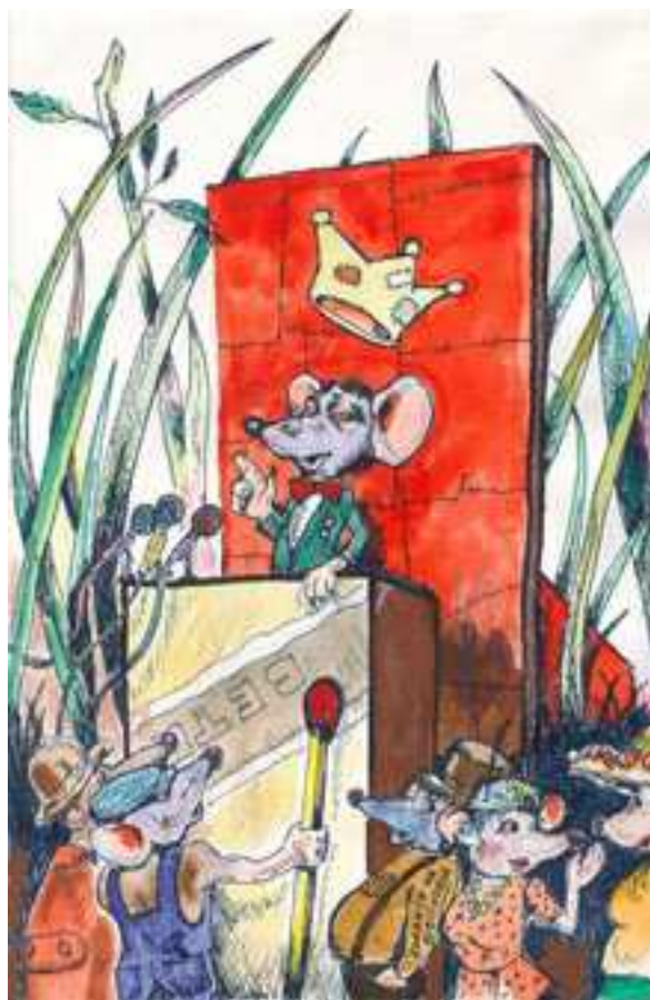
desen de Victor Cilincă