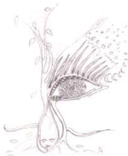
desene de Elena Liliانا Fluture