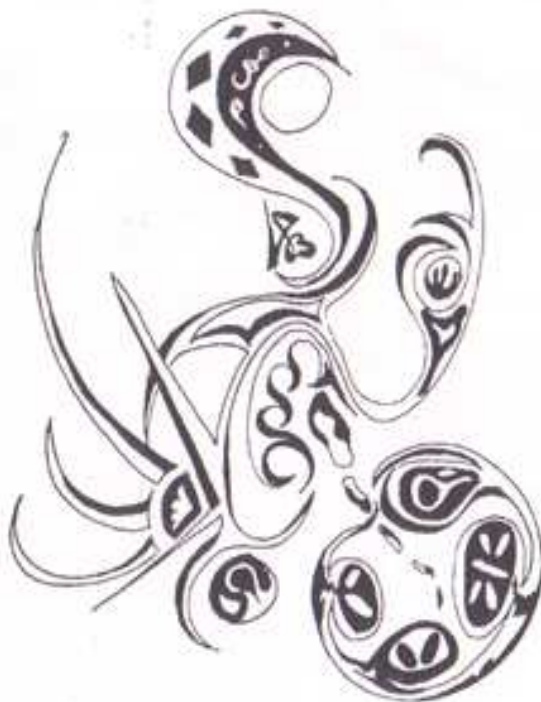
desen de Elena-Liliana Fluture