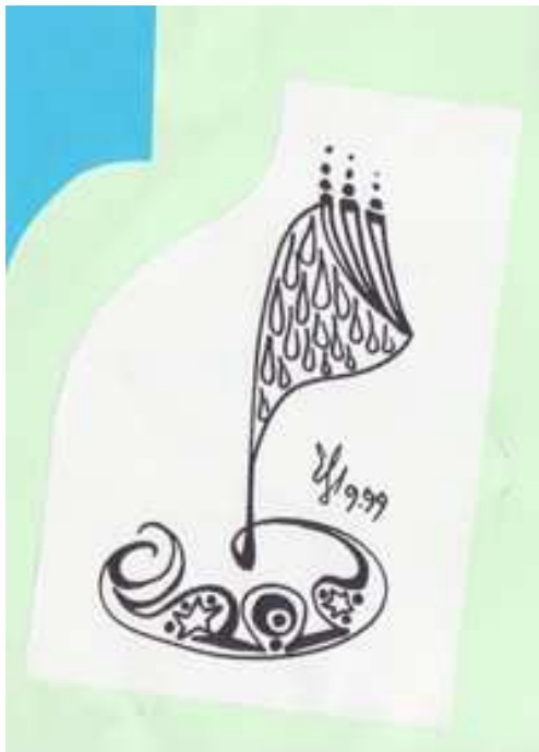
desen de Elena-Liliana Fluture

Fărămiță salută plângăreț și prefăcut - Talian bahtali (să trăiești)! - Săru' mâna, să trăiți, dle dăputat! se sprijină cu spatele de căruță, cu fața către deputat. Continuă pe un ton blând cu simpatie amintindu-și de „prințesili” blonde, fetele deputatului: - Săru' piciorușele la prințesili lu' matala dă la Paris!