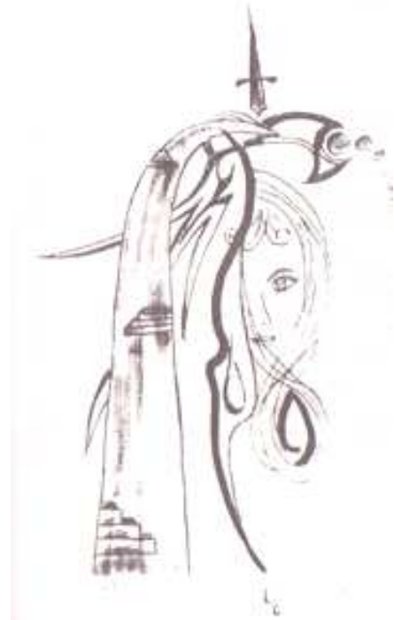
desen de Elena-Liliana Fluture