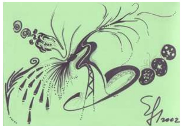
desen de Elena-Liliana Fluture