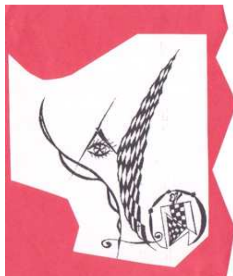
desen de Elena-Liliana Fluture